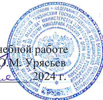
ГРАФИК ПРОВЕДЕНИЯ ПЕРВИЧНОЙ СПЕЦИАЛИЗИРОВАННОЙ АККРЕДИТАЦИИ – 2024 год