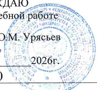
ГРАФИК ПЕРВИЧНОЙ АККРЕДИТАЦИИ – 2026 (для выпускников РязГМУ 2026 года)