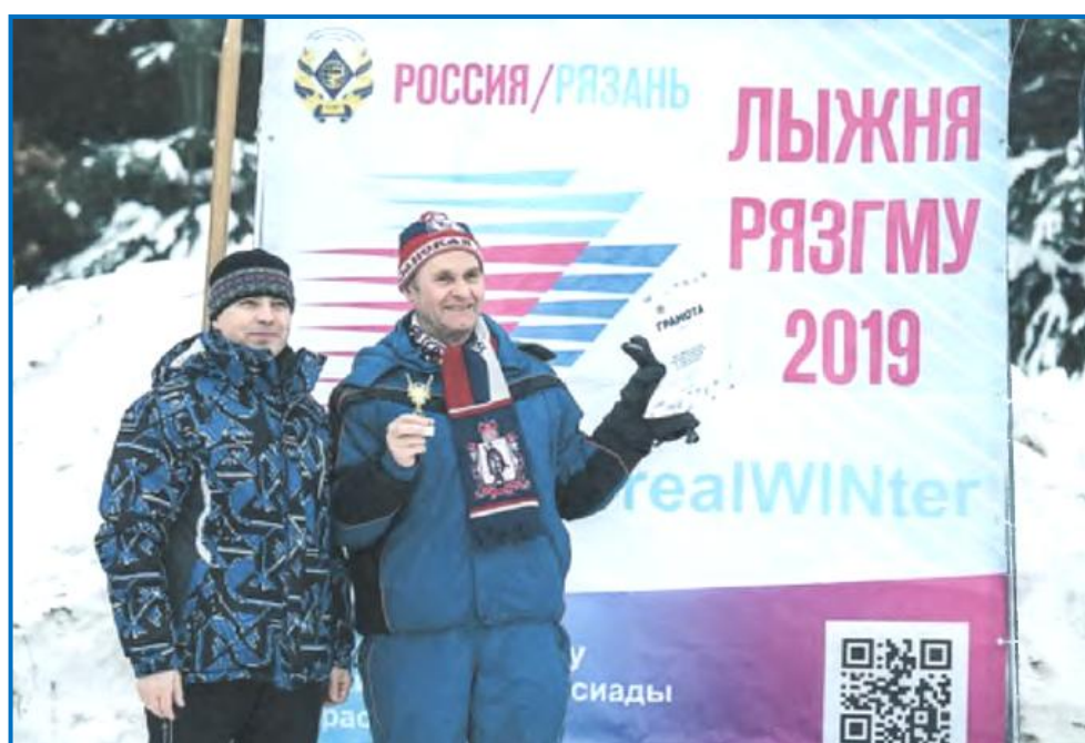
Лыжня РязГМУ – 2019